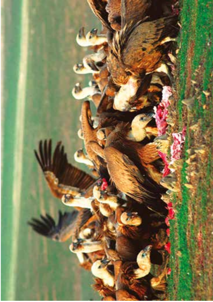
Comoflada © Pablo Fernández-Piero

Mapa ornitológico comarcal Tourist map / mapa turístico